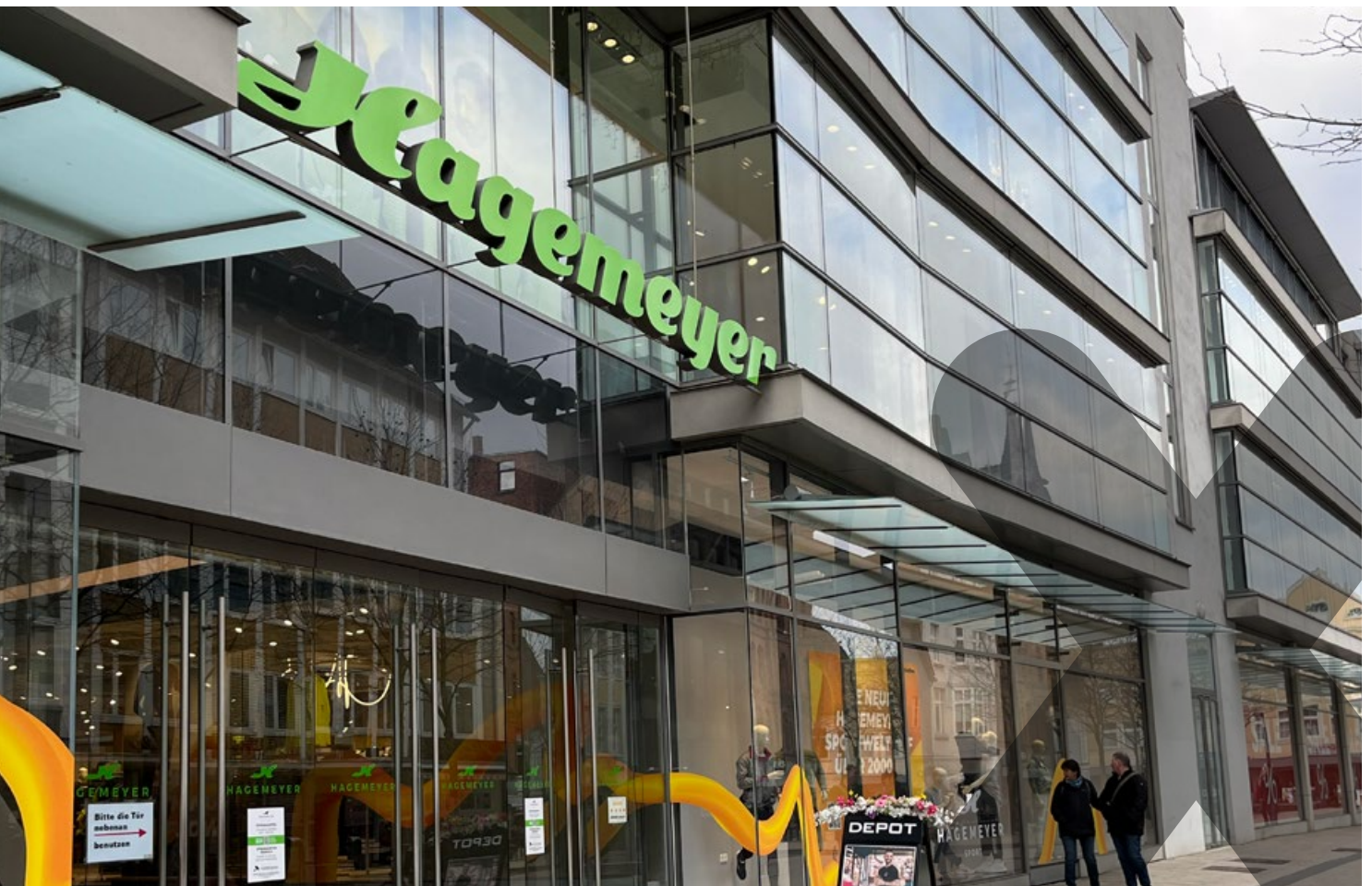
FLACHDÄCHER | DACHANSCHLÜSSE

25 Jahre Qualitäts-Check. Das Modehaus Hagemeyer ist eine Institution in der Innenstadt Mindens. Als vor 25 Jahren Undichtigkeiten am mit Bitumenbahnen gedeckten Flachdach des Technikraums instandgesetzt wurden, kam ein Flüssigkunststoff-System auf Basis von Polymethylmethacrylat (PMMA) zur Anwendung: Triflex ProDetail . Dass dieses Produkt hält, was es verspricht, wurde nun gleich doppelt bestätigt: Ein Materialtest von Bestandsproben in Kombination mit einer erweiterten ETA-Prüfung bescheinigt der Flüssigabdichtung nun eine zu erwartende Nutzungsdauer von 40 Jahren . Dafür wurden auch Probekörper unter anderem vom Modehaus-Dach getestet mit dem Ergebnis: Nicht nur im Labor, sondern auch in der Praxis ist die Abdichtung dauerhaft funktionstüchtig.