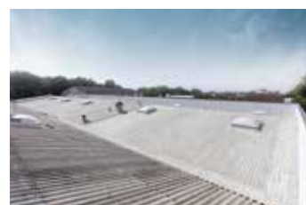
Das Flachdach der Industriehalle nach der Sanierung mit Triflex

„WIR WAREN AUF DER SUCHE NACH EINER LÖSUNG, DIE AUF ALLEN VORHANDENEN UNTERGRÜNDE HAFTET UND AUCH UNTER SCHWIERIGEN BEDINGUNGEN SCHNELL REAKTIV IST – OHNE DABEI DIE SENSIBLE DACHFLÄCHE ZU SEHR ZU BELASTEN. GERADE BEI DER GRÖSSE DES OBJEKTS WOLLTEN WIR AUF NUMMER SICHER GEHEN. DER GUTE AUSTAUSCH MIT DEN TRIFLEX MITARBEITERN UND DIE PRAKTISCHEN SCHULUNGSMASSNAHMEN VOR ORT HABEN UNS VON TRIFLEX PRODETAIL ALS DEM BESTMÖGLICHEN SYSTEM ÜBERZEUGT.“