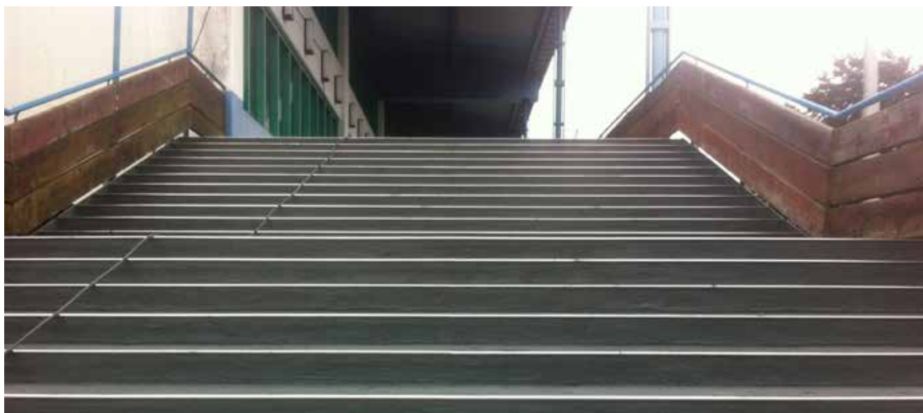
Das Stadion nach der Sanierung mit Triflex

Extreme Wetterbedingungen und regelmäßiger Publikumsverkehr hatten dem Eingangsbereich des Olympia-Eissport-Zentrums in Garmisch-Partenkirchen mit der Zeit zugesetzt. Durch über Jahre entstandene Fehlstellen im Betonbelag war Feuchtigkeit in die Bewehrung und dazwischen liegende Hohlräume eingedrungen. Um das Gebäude langfristig zu schützen, war eine neue Abdichtung erforderlich, die den Belastungen dauerhaft standhält. Gleichzeitig sollte die Lösung schnell zu verarbeiten sein, damit der Boden vor Beginn der Eishockey-Saison und zum G7-Gipfel 2015 fertiggestellt ist. Der Bauherr, die Gemeindewerke Garmisch-Partenkirchen, entschied sich deshalb in Abstimmung mit Hubert Sedlmeir, Gebietsverkaufsleiter Süd-Ost bei Triflex, für eine Lösung mit Triflex ProPark .