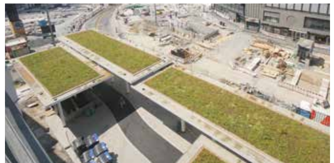
Das Dach der Haltestelle „Jahnplatz“ Vor- und nach dem Neubau

„DIE VERARBEITUNG DER TRIFLEX SYSTEME VERLIEF TROTZ DER SCHWIERIGEN WETTERBEDINGUNGEN WIE GEPLANT. DER SUPPORT DURCH DIE TRIFLEX ANWENDUNGSTECHNIK AUF DER BAUSTELLE WAR SEHR GUT.“