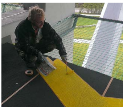
L'area pericolosa della stazione a valle dà una nota di colore con il suo giallo acceso.