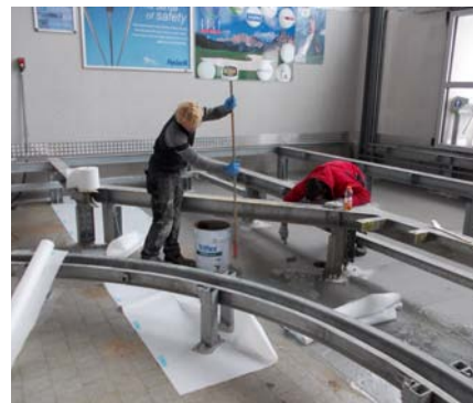
Lo specialista ha applicato il sistema impermeabilizzante Triflex ProPark a base di PMMA sul fondo rivestito di primer.