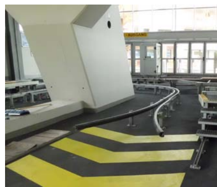
Dopo soli nove giorni la stazione funicolare risanata risplende puntualmente all'inizio della stagione estiva con un'estetica chiara e gradevole.