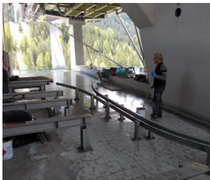
La superficie di 304 mq è stata infine rivestita con Triflex Ceryl Primer 287.