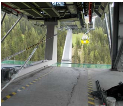
Il pavimento dell'area d'ingresso della stazione a valle non era più impermeabile