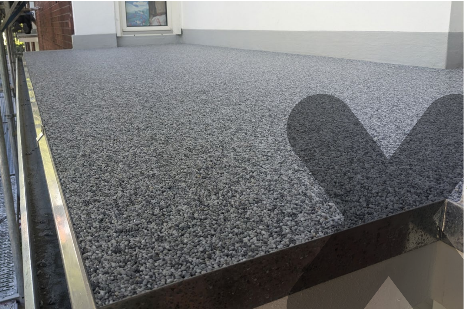
BALKONE, TERRASSEN, LAUBENGÄNGE

Geplant, geholfen, gelöst. Schäden in den Betonplatten waren der Grund für eine umfangreiche Sanierung von knapp 100 Balkonen eines Mehrfamilienhauses im westfälischen Münster. Neben der Anforderung einer sicheren Abdichtung, lag ein besonderer Schwerpunkt auf der ästhetischen Aufwertung der Oberflächen. Die bauliche Sanierung erfolgte mit Triflex Cryl Level 215+ und Triflex ProDetail . Für die optisch hochwertige Oberfläche kam Triflex Stone Design zum Einsatz. Triflex bietet mit dem Steinbelag eine Mischung aus natürlichem Marmorkies oder Granitsplitt und einem Harz auf Basis von Polyurethan. Die Entscheidung für das System fiel nicht nur aufgrund der technischen Vorteile, sondern auch wegen der optischen Gestaltungsmöglichkeiten.