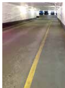
Triflex ProPark Variante 2