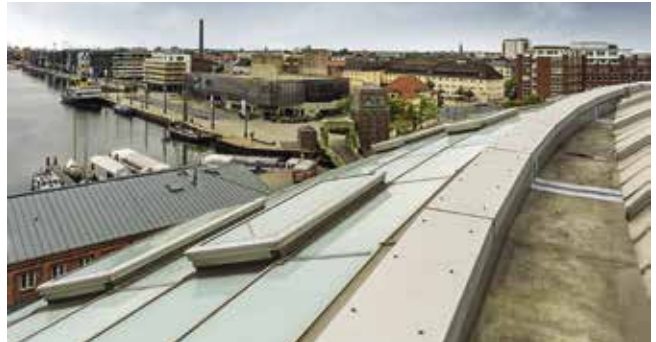
Durch die umlaufende Regenrinne des Klimahauses Bremerhaven war Feuchtigkeit hinter die Dachhaut gelangt und hatte die Dämmung beschädigt. Deshalb war eine neue Abdichtung erforderlich.