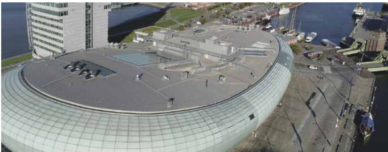
Das Klimahaus nach der Sanierung mit Triflex

Im Klimahaus Bremerhaven lernen jedes Jahr eine halbe Million internationale Besucher die verschiedenen Klimazonen der Erde kennen. Wie sich extreme Witterungsbedingungen auf die Gebäudehülle auswirken können, wurde für den Betreiber des wissenschaftlichen Ausstellungshauses unfreiwillig zum Thema: Die salzhaltige Nordseeluft hatte die Funktionsfähigkeit der Dachhaut beeinträchtigt. In der Folge sickerte das eindringende Wasser über die umlaufende, mit Aluminium ausgekleidete Dachrinne in die Dämmung ein und verursachte auch in den Ausstellungsräumen Schäden. Der Bauherr, die Bremerhavener Entwicklungsgesellschaft Alter-/Neuer Hafen mbH & Co. KG, kurz BEAN, beauftragte deshalb die DADEGO Dachdecker-Genossenschaft Bremen eG mit der sofortigen Instandsetzung der begehbaren Rinne. Gefragt war ein witterungsstabiles Produkt, das auf dem Metalluntergrund haftet und die Bausubstanz nachhaltig schützt. Der Bauherr, der Verarbeiter und Flüssigkunststoff-Hersteller Triflex berieten sich über eine passende Lösung und entschieden, dass die vliesarmierte Abdichtung Triflex ProDetail die gestellten Anforderungen erfüllt. Das System auf Polymethylmethacrylat-Basis (PMMA) ist schnell reaktiv, gleitet auch von senkrechten Flächen nicht ab und bindet selbst komplizierte Geometrien nahtlos ein.