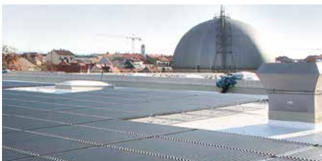
Bei der Sanierung des Daches der Stadtwerke Bamberg mit anschließender Montage der leistungsfähigen Solyndra Photovoltaikanlage kommen die Stärken des hochwertigen und langlebigen Abdichtungssystems Triflex ProTect zum Einsatz. Aufgrund der Widerstandsfähigkeit gegenüber mechanischen und klimatischen Belastungen dichtet der nach ETAG 005 zugelassene Flüssigkunststoff die ebene Dachfläche dauerhaft sicher ab und bietet gleichzeitig mit seiner Versiegelung im Farbton rein weiß einen thermisch unempfindlichen, Sonnenlicht abstrahlenden Untergrund zur umweltfreundlichen Energiegewinnung.